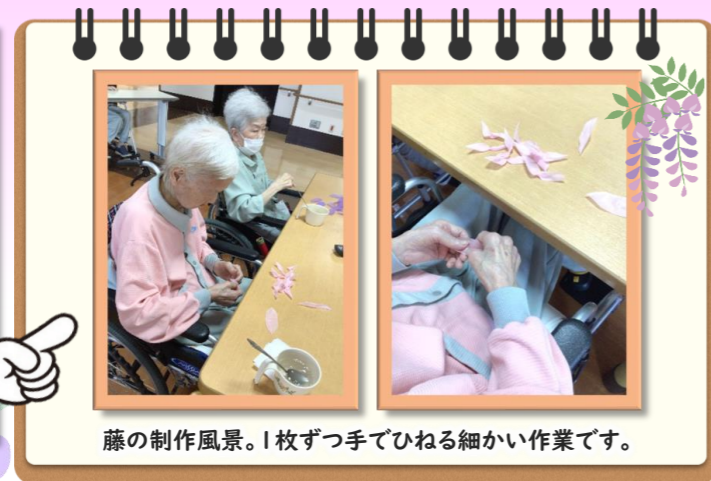
藤の制作風景。1枚ずつ手でひねる細かい作業です。