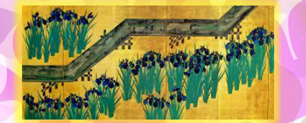
The Met所蔵・尾形光琳「八橋園」↑

橋のまカ大 国 園燕るキ作 宝 の子でツの 級 の花園折 紙 のよう尾 八 でや形 琳 す。園 琳