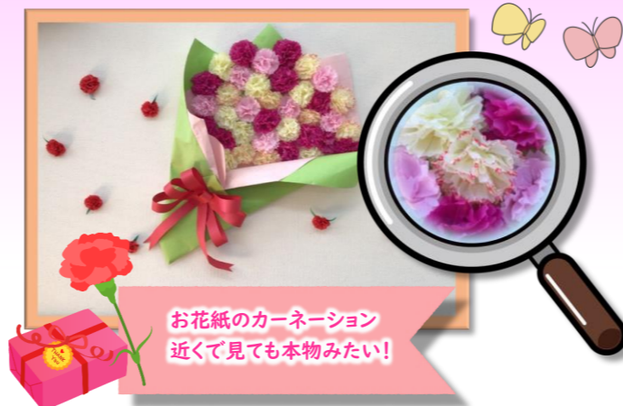
お花紙のカーネーション 近くで見ても本物みたい!