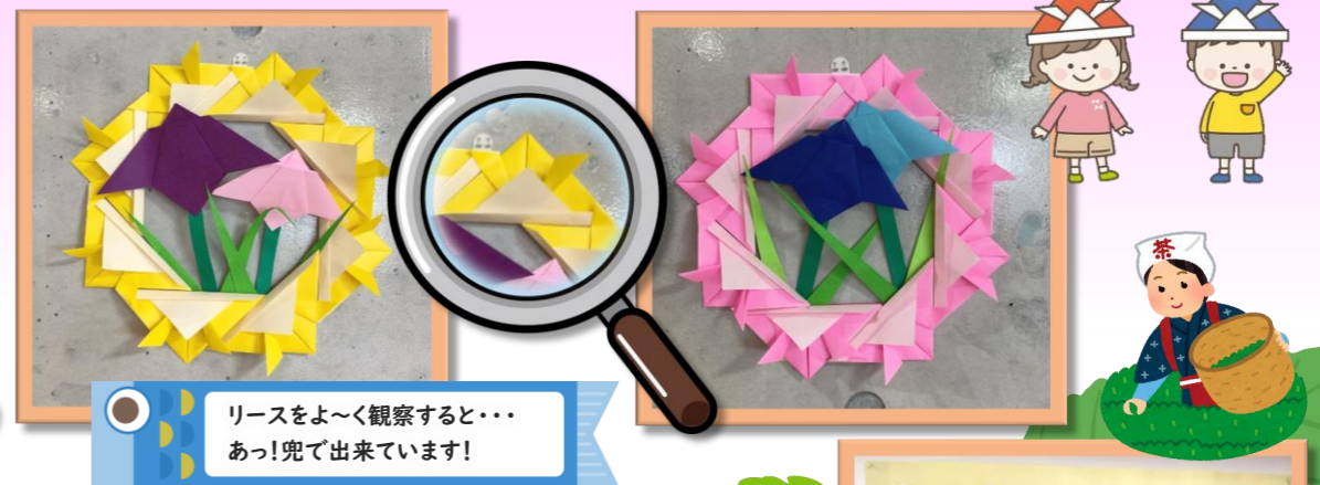
リースをよ〜く観察すると・・・ あっ! 兜で出来ています!